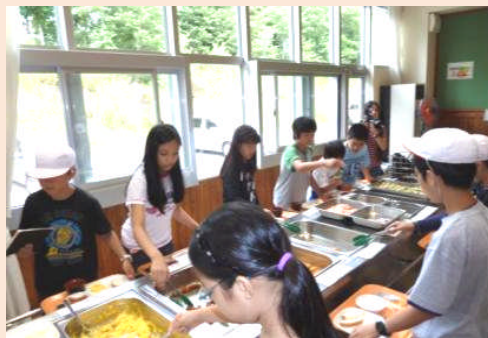
朝食は、昨年からバイキングになりました。バランスの良い食事を心がけます(*^_^*)