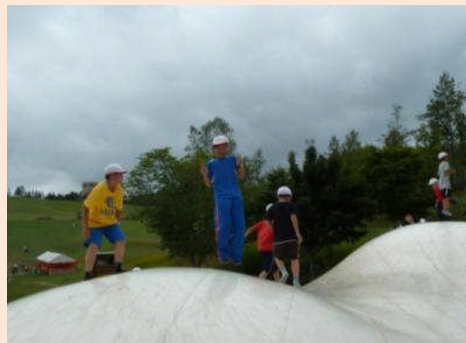
こどもの谷名物「ふわふわエッグ」です。楽しいからって自分たちだけで遊んではいけませんね(^-^)