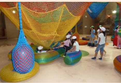
こどもの谷でグループごとに遊びました。「虹の巣ドーム」は、虹色のネットがあり一番上まで登るのは難しいです。(;>_<)