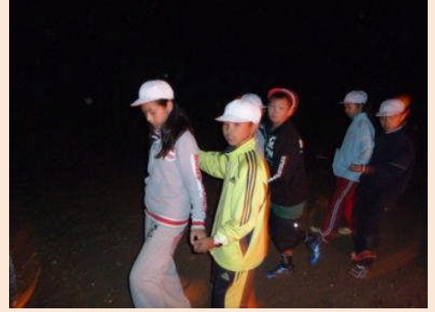
楽しくフォークダンスです。このあとのナイトハイクでは、怖い思いをしました(*_*)