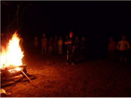
いよいよキャンプファイヤーのはじまりです。(^^)