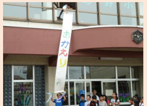
6年生とお母さん方がお出迎えをしてくれました。とっても楽しい2日間でした。(*^_^*)