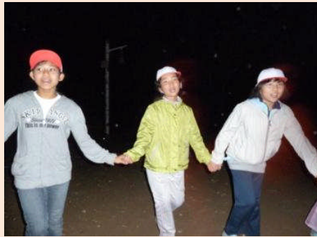
♪マイマイマイマイ マイムベッサン(^^)へブライ語で「水だ水だ万歳」という意味だそうです。