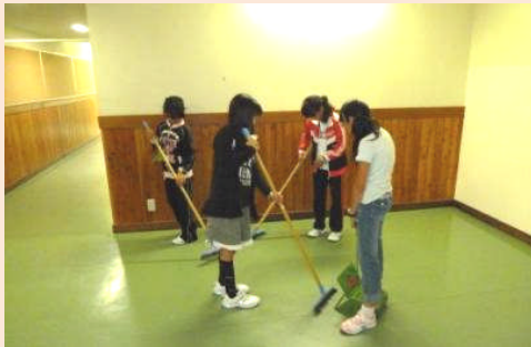
宿泊室だけではなく、廊下やトイレも掃除しました。(^^)