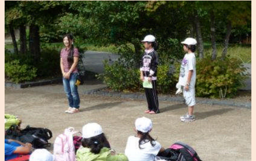
退館式です。2日間お世話になりました。協力することの大切さを学びました。(^^)