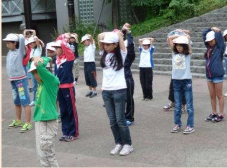
元気に「おはようございます。」あやめ野小学校恒例「朝のあやめ野ストレッチ」です!(^^)!