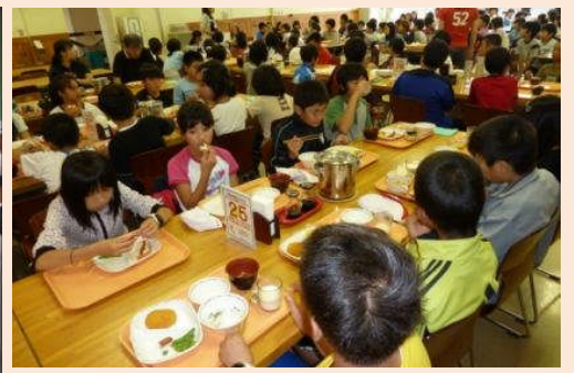
グループごとに「いただきます。」しっかり寝たので食欲もりもり。何度もおかわりをした強者もいました。(*^_^*)