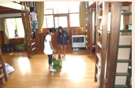
山の家の掃除の約束は「自分が来たときよりもきれいにしよう!!」です(^^)