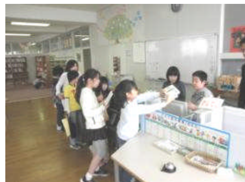
図書委員会の貸出活動