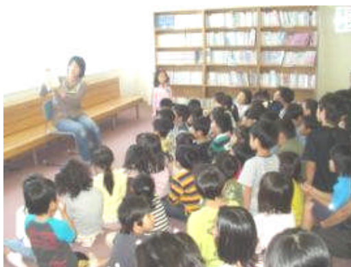
9月の「お話夢ひろば」

教育ボランティアとして始まった『読み聞かせ』も今年で7年目だそうです。現在、朝の読み聞かせは、月曜日が全学年、水曜日が1～3年生に行っています。また、月1回第2水曜日に行われる全校読み聞かせ「お話夢ひろば」も多いときには100名近く集まるほど好評です。来年度も、引き続いて『読み聞かせ』をお願いしたいと思っています。忙しい時間帯でのボランティア活動ですが、これからもご協力をお願いします。